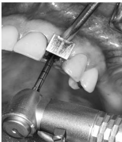
Figura 4 - Avaliação do espaço méso-distal com bandeirinha de 7 mm

A seqüência cirúrgica das perfurações seguiu o protocolo convencional de diâmetros progressivos, atentando-se para o posicionamento mesiodistal e vestibulolingual do implante, que deve ficar em torno de 1 a 2 mm para palatina em relação à vestibular dos dentes vizinhos. A osteotomia foi iniciada com a broca lança na posição ideal, seguida da perfuração na parede palatina do alvéolo a fim de se obter uma prótese aparafusada. O parafuso protético foi colocado no local correspondente ao cingulo, para ancoragem e estabilidade ideal do implante, por apresentar maior volume ósseo e a colocação do parafuso nessa direção permita que se preserve a tábua óssea vestibular. Posteriormente, foi utilizada broca de 2,0 mm com indicador de direção a fim de se verificar a necessidade de ajustes na orientação do implante. Seguiram-se as brocas de 3,5 mm e countersink , pois o implante de escolha foi um Alvim® (Neodent, Curitiba, PR, Brasil), com 3,5 mm de diâmetro e 16 mm de comprimento.