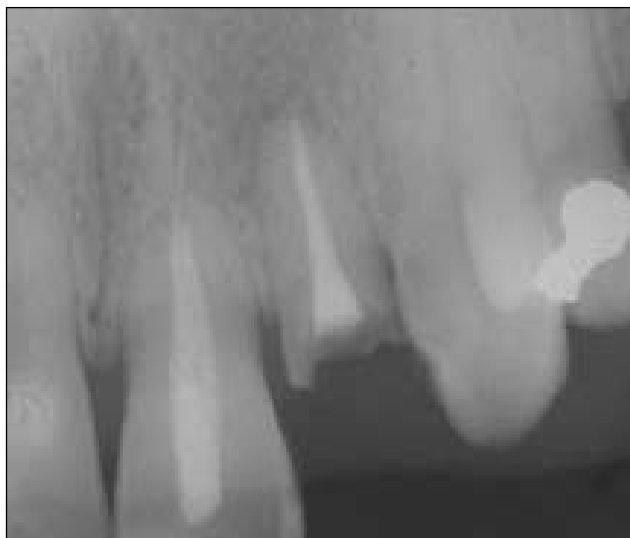
Figura 2 - Radiografia periapical da região do elemento dentário fraturado

Inicialmente, foram realizados anamnese e exame físico, nos quais foi verificada ausência dos elementos 14, 15, 25 e 26. Também foram realizados exames radiográficos periapical (Fig. 2) e panorâmico. A radiografia periapical do dente 22 comprovou haver fratura no terço cervical da raiz e reabsorção no ápice radicular, contra-indicando a preservação do dente. Constatou-se também que, após a extração do referido elemento, haveria remanescente ósseo para a fixação de um implante. Dessa forma, a opção de tratamento constituiu-se na instalação de implante unitário imediatamente após a exodontia.