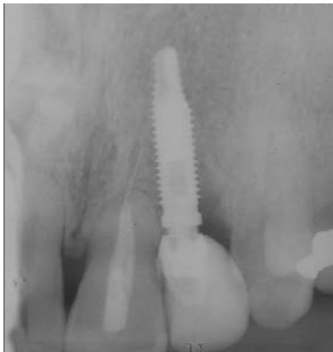
Figura 8 - Radiografia periapical final