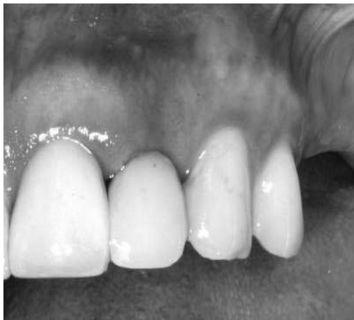
Figura 7 - Colocação do provisório imediatamente após a instalação do implante

O paciente autorizou a publicação deste caso por meio da assinatura de um termo de consentimento livre e esclarecido.