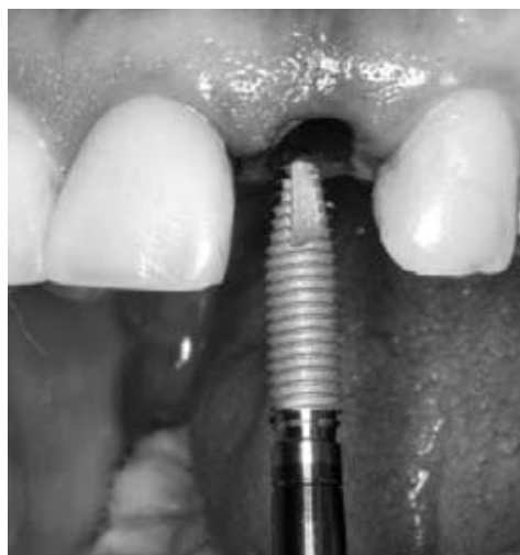
Figura 5 - Instalação do implante Alvim® 3,5 x 16 mm

A fixação (Fig. 5 e 6) foi realizada em 30 RPM, mantendo o implante em torno de 3 mm abaixo da futura margem gengival, na direção da junção amelo-cementária. O travamento foi realizado com torque de 40 N/cm, o que revelou estabilidade primária suficiente para a utilização da filosofia de carga imediata.