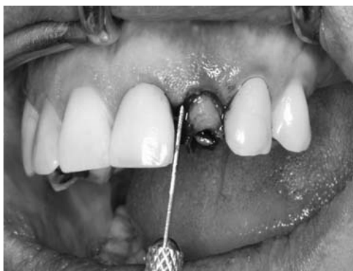
Figura 3 - Extração atraumática da raiz fraturada

Inicialmente, foram realizadas anestésias infra-orbitária, terminal infiltrativa e palatina. Em seguida, foi realizada a sindesmotomia, com o intuito de liberar as fibras gengivais e dar acesso ao ligamento periodontal, o qual foi descolado com lâmina de Bivers (Nordic Biotech®, Copenhagen, Dinamarca), com a finalidade de não romper o contorno gengival e manter a papila em posição, evitando perda óssea e deslocamento do arcabouço côncavo regular existente. Com isso, conseguiu-se realizar a extração atraumática do elemento dentário (Fig. 3). A partir daí, iniciou-se a osteotomia, avaliando-se sempre a posição ideal do implante associada à posição da futura prótese (Fig. 4).