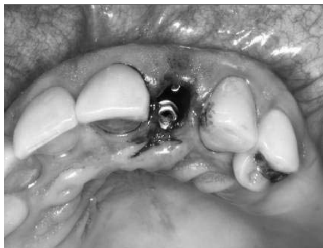
Figura 6 - Implante instalado